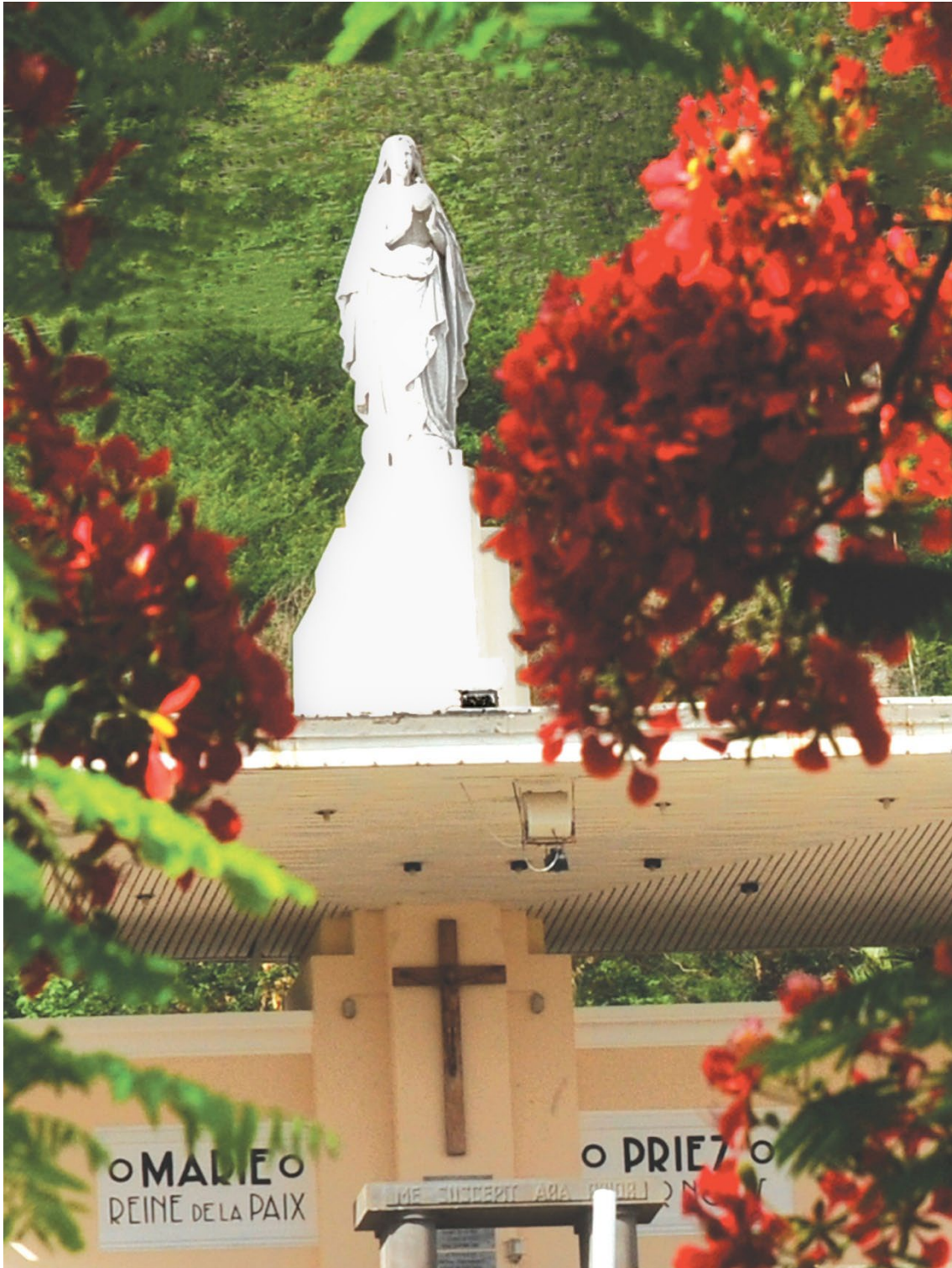
Marie Reine de la Paix, est un sanctuaire marial érigé en 1940 pour demander à